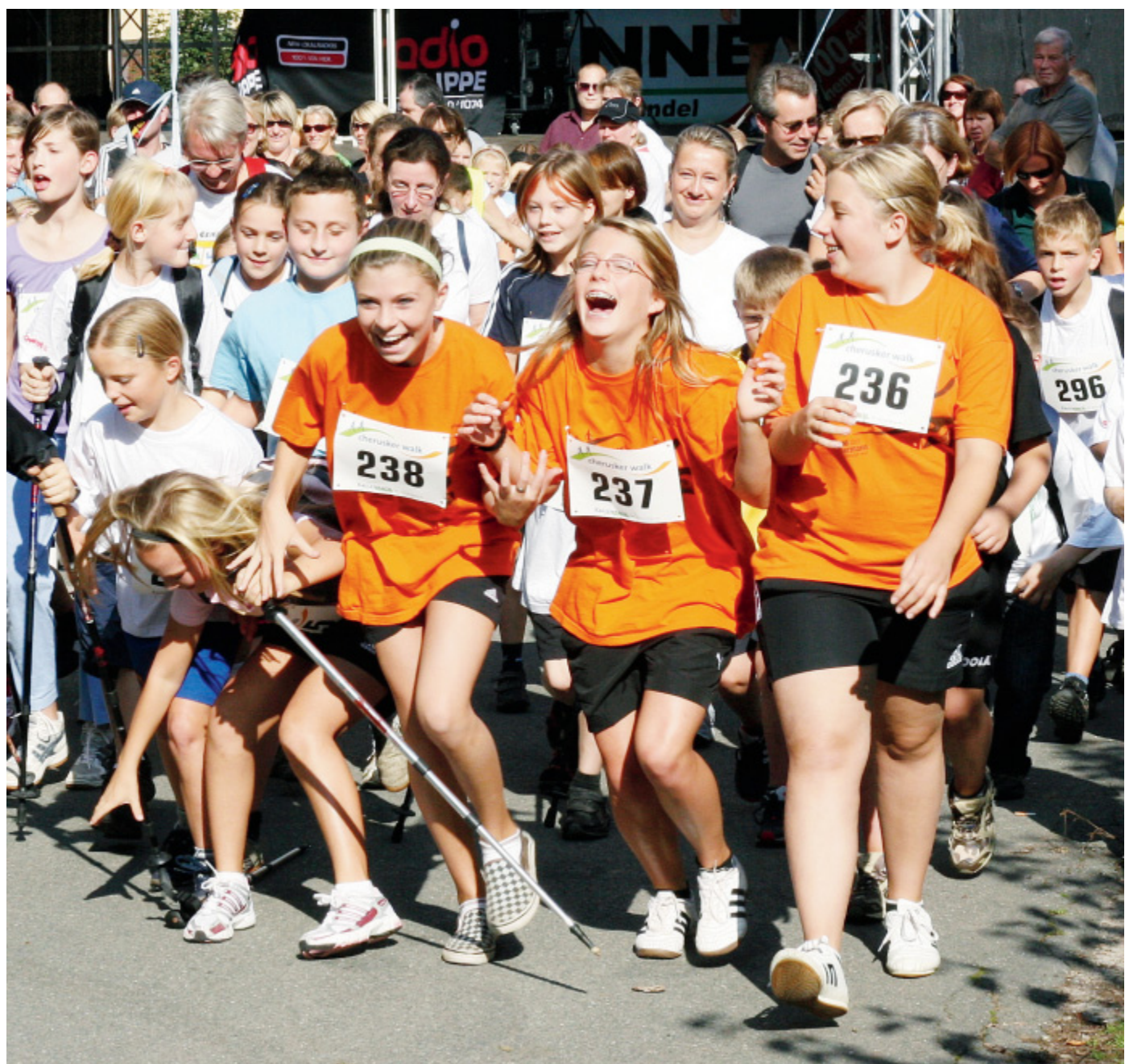
Auf die Plätze, fertig, los: Der „Kids Walk“ startet Sonntag um 11 Uhr, die Siegerehrung ist dann um 13 Uhr. Landrat Friedel Heuwinkel eröffnet den „Cherusker Walk“ um 9.45 Uhr. Die Siegerehrungen der einzelnen Strecken sind für 14 Uhr vorgesehen.

TuS Holzhausen-Externsteine bietet neues Konzept für den „Cherusker Walk“